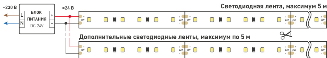
Схема 1. Подключение нескольких светодиодных лент с одной стороны.

Максимальная длина подключения ленты – 5 м (1 катушка).